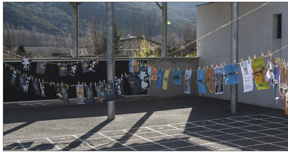
"La grande lessive" reprend le principe de l'étendage du linge comme modalité d'exposition grâce à des créations artistiques créées par des gens du monde entier.

En reprenant le principe d'étendage du linge comme modalité d'exposition, "La grande lessive" propose de développer le lien social grâce à la pratique artistique. Sous la forme de plusieurs milliers d'installations simultanées dans le monde entier le temps d'une journée, il s'agit de rassembler les réalisations (dessin, peinture, collage, photomontage, photographie, poésie visuelle, conception numérique...) à l'aide de pinces à linge pour une durée limitée.